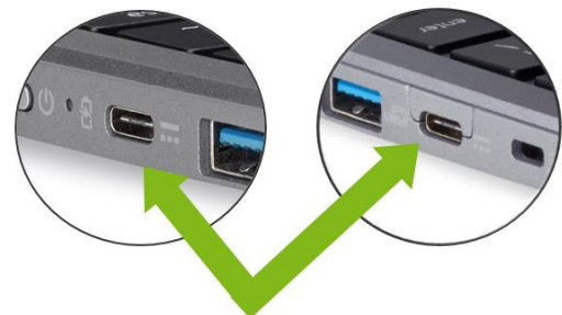
Designed for a reversible USB Type-C cable